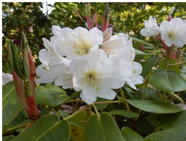
R. fortunei, bredblada form

Organisasjonsnr. 913332180 MVA Postgiro: 1503 45 55351 Tlf: 41588630 E-post: olejonnylarsen@hotmail.com Hjemmeside: www.lapponicum.com